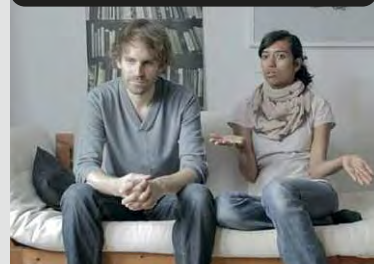
HANS-PETER FELDMANN – KUNST KEINE KUNST